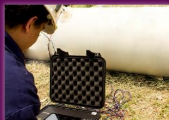
Ilustración 1. Montaje en Campo de Técnica EIS