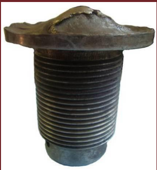
Figura 2. Inspección visual de un elemento fallado