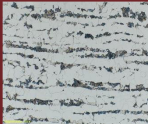
Figura 1. Resultados microscopía electrónica de barrido y metalografía