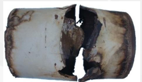
Figura 5. Falla sistema de transporte de crudo

Análisis de falla es una herramienta que busca aportar al mejoramiento continuo de la confiabilidad e integridad de los sistemas, y que permite a nuestros clientes promover las mejores prácticas internacionales y nacionales de la industria, en su compromiso de garantizar y mantener la operación segura que garantice protección de las personas, del medio ambiente, y de los activos de la empresa.