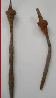
Figura 4. Falla en pernos acueducto