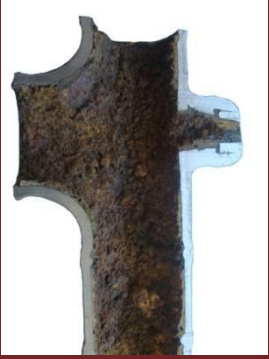
Figura 3. Falla en Sistema de Transporte de Agua