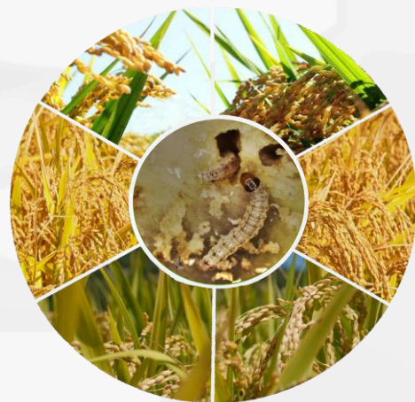
Figura 3. Caracterización del microbioma de Diatraea saccharalis

La CIC ha incursionado en la caracterización de microbiomas asociados a los suelos de cultivos citrícolas, de cacao y café, al ser éstos clave en el departamento de Santander. Así mismo, se han caracterizado microbiomas asociados a pestes entomológicas de la caña de azúcar ( Diatraea saccharalis ) y suelos contaminados con heces de caprinos, con el objeto de identificar biocatalizadores con potencial importancia agrícola y ambiental (Figura 3 y Figura 4.).