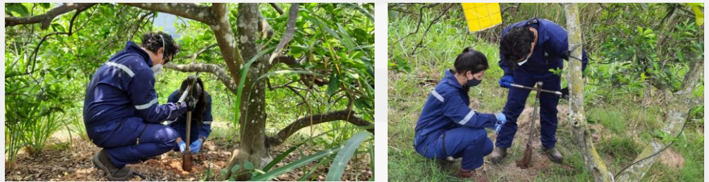
Figura 1. Análisis de suelos cítricos en una finca de producción orgánica de Girón, Santander.

El suelo es la base productiva de la agricultura y allí convergen simultáneamente numerosas interacciones entre sus factores físicos, biológicos y químicos. Obtener información integral de los suelos productivos resulta clave a la hora de mejorar su productividad y funcionalidad ( Figura 1 ). Con el desarrollo de nuevas tecnologías, las actividades económicas y las sociedades se transforman. En el agro, la aplicación de nuevas tecnologías ha dado paso al desarrollo de la denominada agricultura de precisión. Esta integra información y herramientas tecnológicas para el uso eficiente y sostenible de los recursos naturales del planeta, mientras genera beneficios en el desarrollo agrícola y ambiental.