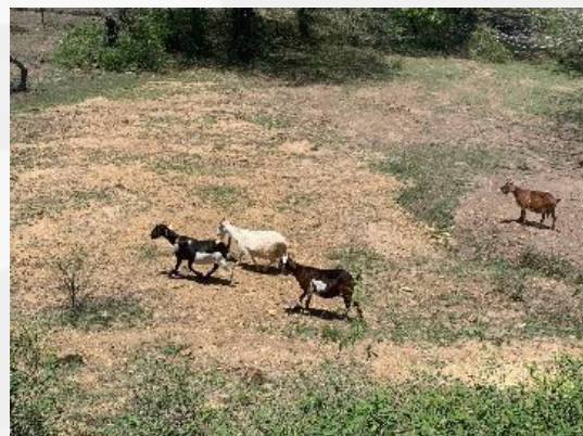
Figura 4. Caracterización del microbioma de suelos contaminados con heces de caprinos.